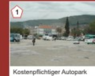
1 Kostenpflichtiger Autopark