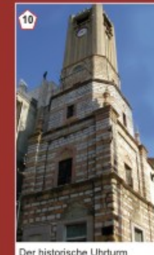
10 Der historische Uhrturm