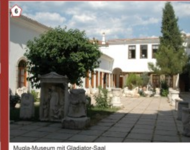
6 Mugla-Museum mit Gladiator-Saal