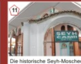
11 Die historische Seyh-Moschee