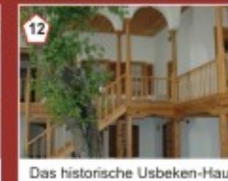
12 Das historische Usbeken-Haus