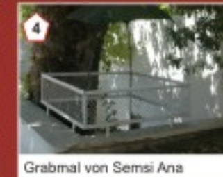
4 Grabmal von Semsî Ana