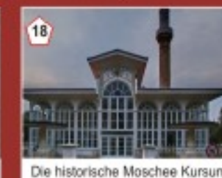
18 Die historische Moschee Kursunlu