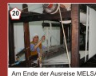
20 Am Ende der Ausreise MELSA