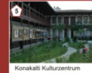
5 Konakalti Kulturzentrum