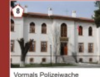
8 Vormals Polizeiwache