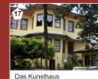
17 Das Kunsthause