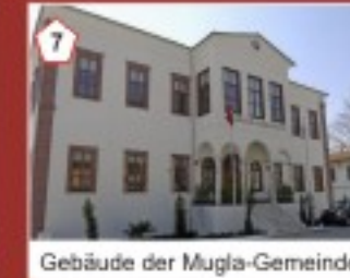
7 Gebäude der Mugla-Gemeinde