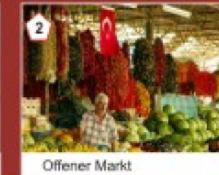
2 Offener Markt