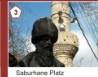
3 Saburhane Platz