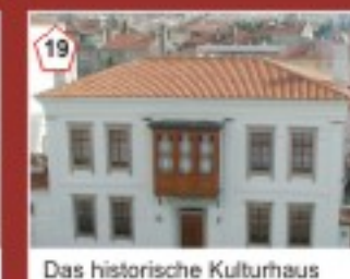
19 Das historische Kulturhaus